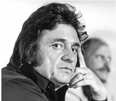
Bildmaler aus Arkansas: Country-Sänger Johnny Cash, 1970 in München

Am Ende seiner Lebenszeit hat er ein sehr aktives Leben geführt, was auf den größten Erfolg seiner Karriere zurückzuführen ist. Er hat sich immer noch mit seiner Musik auseinandergesetzt und ist immer noch ein wichtiger Teil der Musikwelt. Er hat sich immer noch mit seiner Musik auseinandergesetzt und ist immer noch ein wichtiger Teil der Musikwelt. Er hat sich immer noch mit seiner Musik auseinandergesetzt und ist immer noch ein wichtiger Teil der Musikwelt.